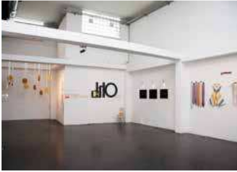
JAKOH!MINI. 17 Blicke in den städtischen Alltag: Unter diesem Titel präsentierende Studierende des Master-Studiengangs „Ausstellungsdesign“ die Ergebnisse ihrer zweimonatigen Recherche zum Jakominiviertel.

„Das Studium zeichnet sich durch einen sehr praxisorientierten Lehrplan aus. Es gibt viele Projektarbeiten, von denen einige realisiert werden. Aufgrund des breit gefächerten Studienplans, der zum Beispiel Grafikdesign, Innen- und Außenraumgestaltung beinhaltet, bekommt man einen differenzierten Blick auf die Welt und wie sie funktioniert.“