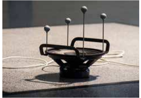
Interaktives Klangobjekt aus dem Projekt Klangräume (Kooperation mit dem Institut für Elektronische Musik und Akustik)

Das Studium qualifiziert unsere Absolventinnen und Absolventen für Berufe in Unternehmen der Medien- und Kommunikationsbranche, aber auch in der industriellen Produktion. Sie sind dort tätig, wo Klanggestaltungskompetenz gepaart mit technologischen Fähigkeiten, Forschungskompetenz und Leadership gefordert sind. Tätigkeitsfelder sind beispielsweise Audio-Produktion und Postproduktion, Sonic Interaction Design, Sonifikation, Product Sound Design, Corporate Sound Design, Audio Branding, Computer Games und Werbung. Absolventinnen und Absolventen können in praktisch jedem klangbezogenen Arbeitsumfeld arbeiten und leisten in Produktionsteams, egal in welchem Medienkontext, einen wichtigen und kritischen Beitrag zur Rolle von Klang.