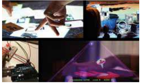
Interaction Design / Projekte von Studierenden

Interaction-Designerinnen und -Designer bewegen sich als Generalistinnen und Generalisten in einem dynamischen Gestaltungsfeld mit großer wirtschaftlicher Bedeutung. Sie arbeiten zu Themen wie Human Computer Interfaces, Virtual Reality, Mobile-Design, Interactive Storytelling, Service Design und Internet of Things. Tätig sind sie beispielsweise in Usability-Departments der Industrie, Forschungs- und Entwicklungseinrichtungen, Game-Design-Firmen, UX-Designbüros, Medienagenturen, Webagenturen oder als selbstständige UI-/UX- und App-/Mobile-Designerinnen und -Designer.