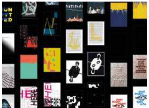
Journey of Hope: Plakatausstellung zur Flüchtlingsproblematik im Grazer Kunsthaus.

Das Berufsfeld unserer Absolventinnen und Absolventen liegt in den Creative Industries. Das sind zum Beispiel Designbüros, New Media Agencies, Verlage, Printmedien, Internet-Broadcaster oder Film- und Videoproduktionsfirmen. Zudem können unsere Absolventinnen und Absolventen ihr Studium mit einem Master-Studium fortsetzen, an der FH JOANNEUM zum Beispiel mit „Ausstellungsdesign“ oder „Communication, Media, Sound and Interaction Design“.