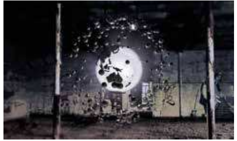
Screenshot aus dem Kurzfilm Zahlenpoesie . Ein Projekt der FH JOANNEUM mit der schule für dichtung wien (sfd)

Die Konzentration auf neue narrative Formen, die Verbindung von konzeptionellen und gestaltungstechnischen Inhalten sowie interdisziplinäre Aspekte des Studiums ermöglichen unseren Studierenden ein vielfältiges und abwechslungsreiches Berufsfeld. Absolventinnen und Absolventen stehen viele Möglichkeiten offen, sich professionell zu spezialisieren. Sie arbeiten in der traditionellen Video- und Filmproduktion ebenso wie als Spezialistinnen und Spezialisten des Motion-Designs, On-Air-Designs, Game Designs sowie in zahlreichen interdisziplinären Settings.