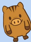
神戸大学公式マスコット「神大うりぼー」 Kobe University Official Mascot, Shindai Uribo

You can improve your conversational ability by discussing the topics covered in class with Kobe University students.