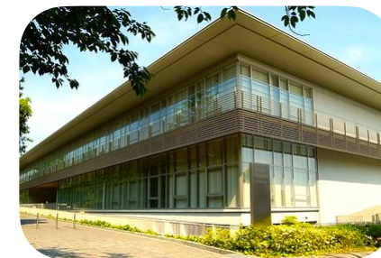
神戸大学グローバル教育センター Global Education Center