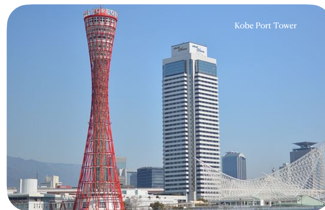
Kobe Port Tower

We will carry out fieldwork in various locations in Kobe.