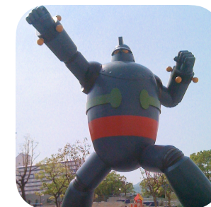
鉄人28号モニュメント 神戸市長田区

□往復の渡航費、宿泊費、滞在費(食費・交通費)、海外旅行保険(疾病・傷害・賠償責任)は学生の個人負担とします。Participants will be responsible for their travel to/from Japan, transfers, accommodation, living expenses (food, local travel) and overseas travel insurance (illness, injury, liability)