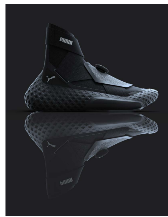
PUMA NAO – ein Outdoor-Basketballschuhkonzept von Julian Loretz PUMA NAO: a concept for an outdoor basketball shoe by Julian Loretz